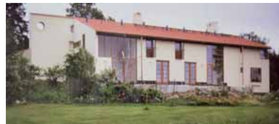
Satulantekijän torppa - myös yksi ensimmäisistä Tikirakin rakennuskohteista.