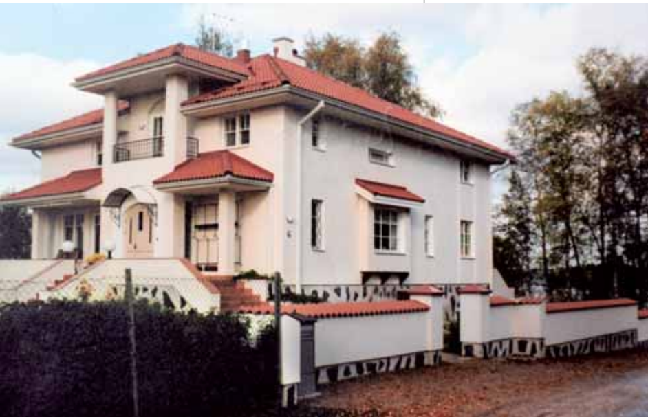
Tikirakin ensimmäisiä kohteita oli omaleimainen Murajan talo.