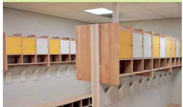
Sammon päiväkoti, Tampere.