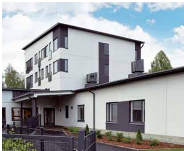
Mehiläinen Oy Villa Marttilanharju, Sastamala.