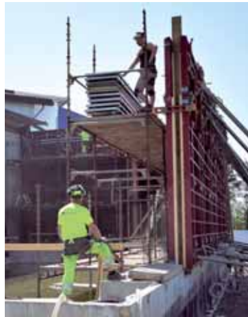
Kangasalan uimahallin laajennus on vaativa rakennushanke, jonka yhteydessä hyödynnetään muun muassa paikallavaltuutettua tekniikkaa.