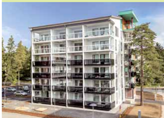
As. Oy Kangasalan Vääränkalliontie 1, Kangasala