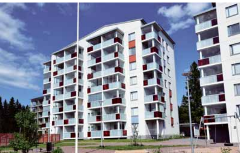
Harjunsalontie 2 -kortteliin Kangasalle valmistuivat 2016-2017 As. Oy Kangasalan Herttua, As. Oy Kangasalan Markiisi ja hoivakoti Attendo Herttuatar.