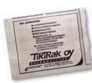
Laadukasta jälkeä kehtaa jo hiukan kehuakin. Lehti-ilmoitus Sydän-Hämeen lehti 8.8.1994.

Viime vuosina on rakennettu myös hoiva-yksiköitä Kangasalalle, Pälkäneelle ja Sastamalaan.