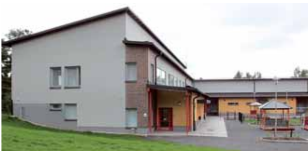
Palmurinteen päiväkoti, Valkeakoski.